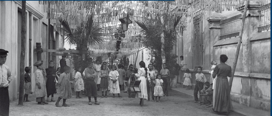
Carrer de Sant Esteve engalanat amb garlandes i fanalats davant de la Torre de l'Esquena, a principis del segle XX.