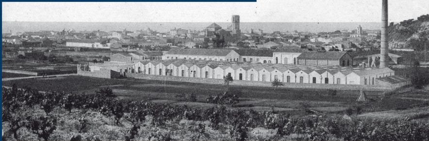
Vista de la fàbrica de l'Aigua des de la zona alta de l'actual barri de la Verreda. Postal de Fototipia Thomas (Josep Thomas i Bigas) de principis del segle XX