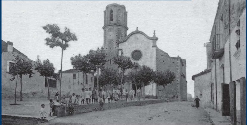
Vista de la coneguda com a "plaça de missa", amb l'església al fons, a principis del segle XX.