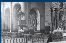
A l'esquerra: interior de l'església a principis del segle XX.

A la façana del carrer del Carme es conserva la paret d'una antiga capella dedicada al Sant Crist amb la inscripció de "A 20 DE 9bre (novembre) DE l'Al(any) 1703". L'agost de 1936 l'església fou cremada i desaparegueren molts elements decoratius, com ara el retable barroc de la part dreta de la imatge de sota.