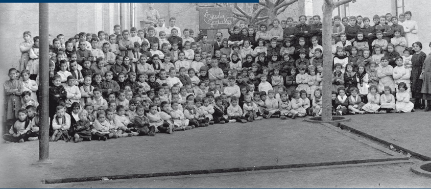
Alumnes i professors de l'Escola Fonlladosa a la dècada de 1920.