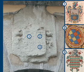
1. Escut de cavaller de Felip de Mercader i de Saleta. ACA 2. Escut de la família Sadurn. ANC 3. Escut de la família Sitges. ANC

Construït a finals del segle XVI, l'edifici ha complert diferents funcions. Primer fou casal fortificat de la família Clapers i, a finals del segle XVIII, hospital de sang. Passà a mans dels Mercader i més tard dels comtes de Bell-lloc. El 1886, es convertí en seu del Casino Malgratense i, des de l'any 1926, local de la Cooperativa Obrera de Consum La Malgratense. A partir de 1939, continuà funcionant com a botiga. L'edifici fou adquirit per l'Ajuntament el 1991. Des del 2000 funciona com a Biblioteca Municipal.