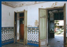
Interior de l'edifici abans de la seva rehabilitació.