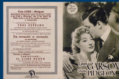
Postal amb el programa de projecció de pel·lícules per al dijous 2 d'abril de 1950.

Si preguntem o investiguem descobrirem que a mitjans del segle XX Malgrat disposava de quatre sales de cinema. El Tivoli (antic Guimerà, al carrer de Maó, avui desaparegut); el Centre Parroquial (abans Foment Cultural), al carrer del Carme, avui convertit en Centre Cultural; i els esmentats cinemes Liceu i Tropical. I encara havia de néixer un nou cinema, el Majèstic, al carrer de Mar, que funcionà des de 1970 a 1993, amb alguna interrupció.