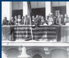
Personalitats dalt del bató de l'ajuntament, amb motiu de la visita del president de la Generalitat Francesc Macià el 20 de setembre de 1931.

Ha sofert notables canvis tant a l'exterior com a l'interior. A l'exterior, el més rellevant és l'ampliació per la banda sud, cosa que trenca l'estructura de tres cossos inicials en què estava construït l'edifici. L'interior està totalment renovat i adequat a les noves funcionalitats d'un ajuntament modern.